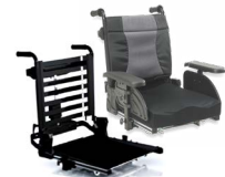
Rücken: ARJ 2171