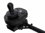
2231 / 2232