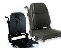
Rücken: ARJ 2172 bzw. 2173